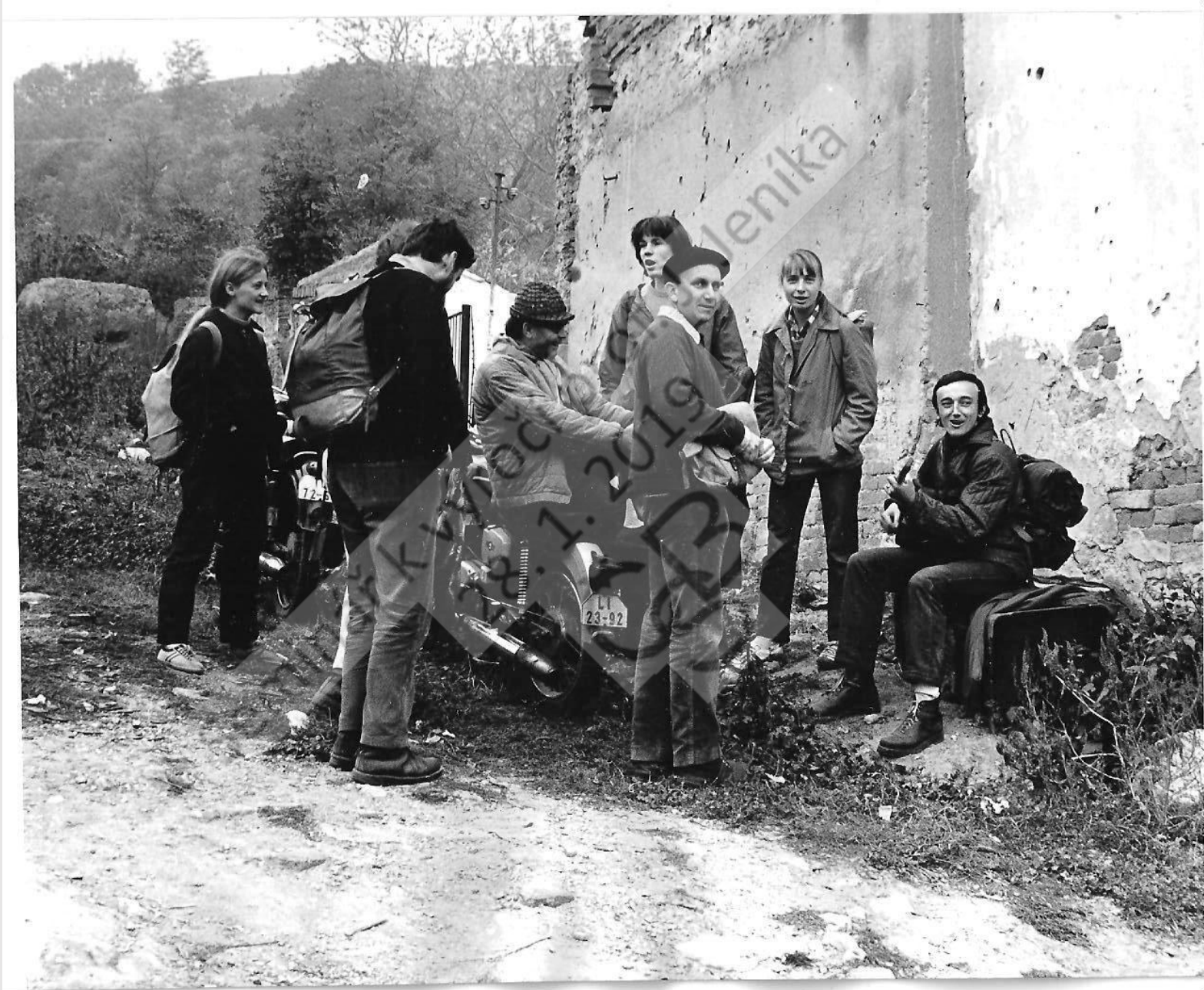
Pálava, podzim 1970, Foto ?