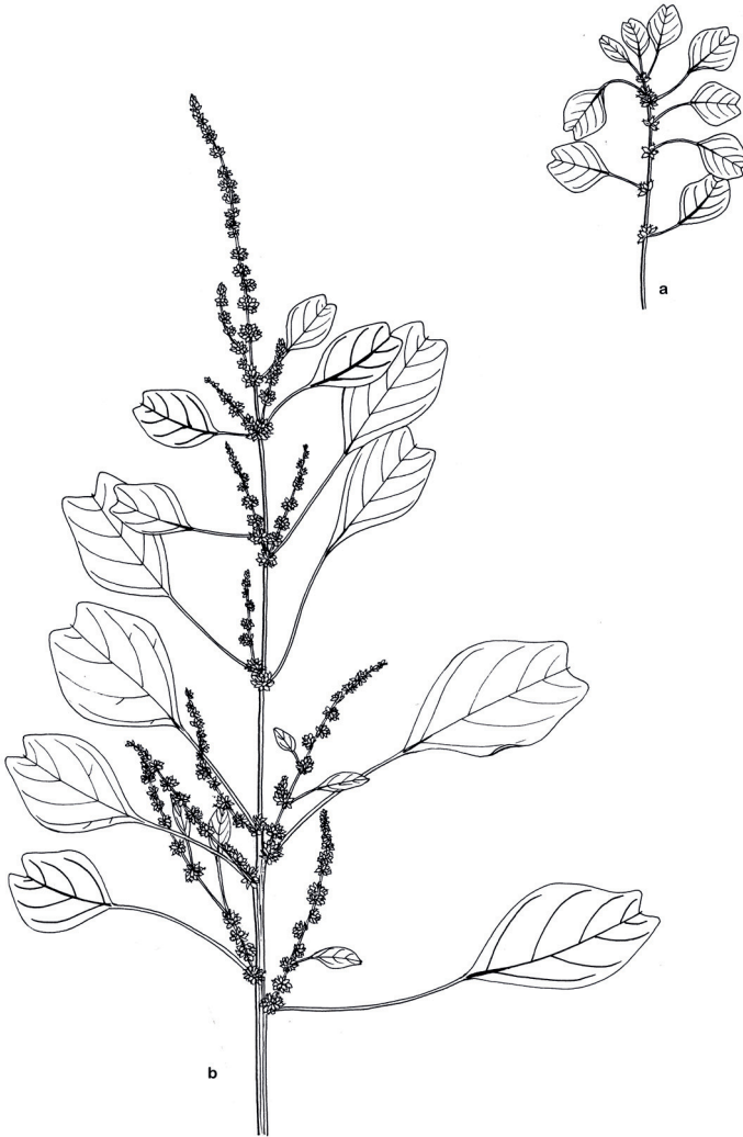
Obr. 4. a – A. emarginatus subsp. emarginatus – koncová část plodné lodyhy, b – A. emarginatus subsp. pseudogracilis – koncová část plodné lodyhy. Del. Z. Komárová.

Fig. 4. a – A. emarginatus subsp. emarginatus – terminal part of fruiting stem, b – A. emarginatus subsp. pseudogracilis – terminal part of fruiting stem. Drawing Z. Komárová.