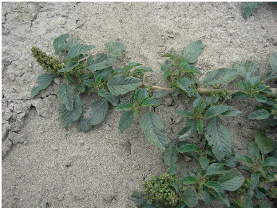
Obr. 2. – A. blitum var. blitum – Slovensko: Malé Trakany, suchý písčitý břeh řeky Tisy.