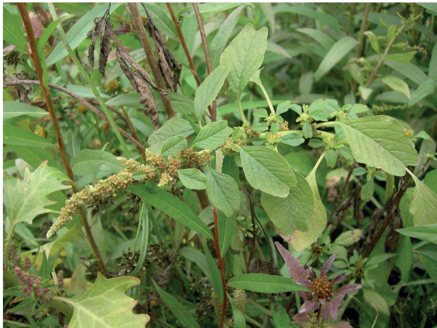
Obr. 6. – A. emarginatus subsp. pseudogracilis – Slovensko: Bratislava-Devínska Nová Ves, osada Devínske Jazero, vlhký písčito-bahnitý břeh řeky Moravy.

Fig. 6. – A. emarginatus subsp. pseudogracilis – Slovakia: Bratislava - Devínska Nová Ves, settlement of Devínske Jazero, wet sandy-muddy bank of the Morava River.