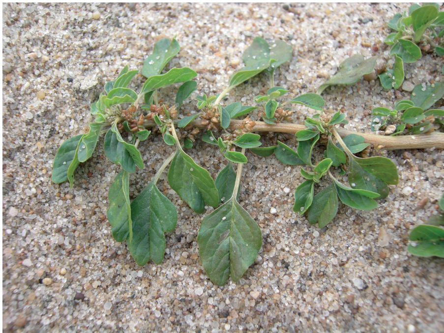
Obr. 5. – A. emarginatus subsp. emarginatus – Německo: Damnatz, vlhký písčité břeh řeky Labe (, 9. 9. 2015).