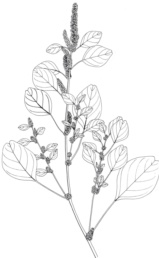
Obr. 1. – A. blitum var. blitum – koncová část plodné lodyhy. Del. Z. Komárová.