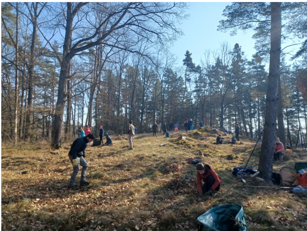
Brigáda na Kozím vršku 22. 2. 2025