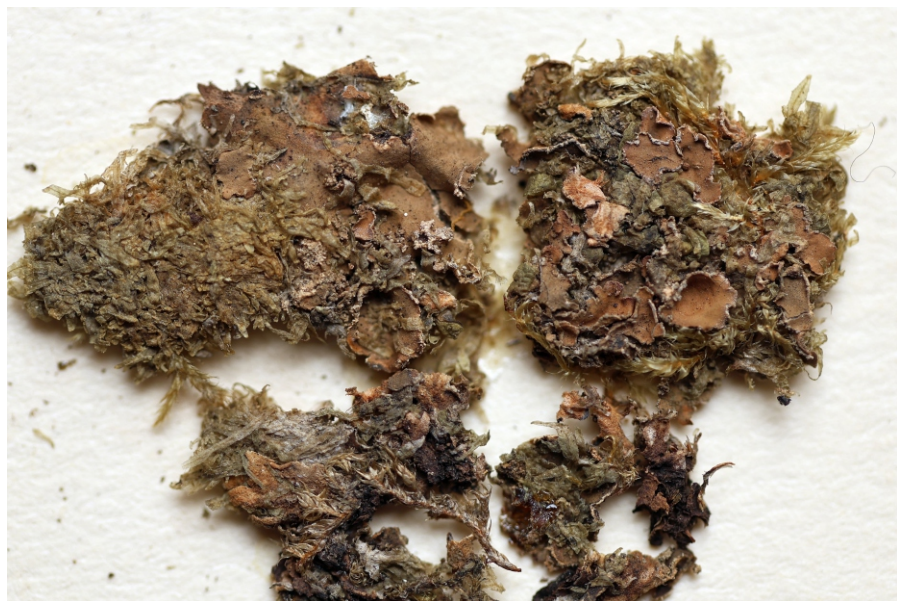
Obr. 2. Položka Peltigera collina PLL 116/126.

Peltigera collina je druhem rostoucím ve střední Evropě na mechatých kmenech stromů a mechatých skalách ve vlhkých pralesovitých porostech. V minulosti byla u nás nacházena vzácně, většinou v horách a ojediněle i v nižších polohách. V současné době je znám výskyt jen na Šumavě (Malíček et al. 2025). Z Brd dosud žádné údaje neexistovaly. Místo Malochova brdského sběru je dnes na mapách označováno jako „U Kostelíka“ a jedná se o mělké údolí Zlatého potoka s pozůstatky kláštera Tesliny a dvěma rybníčky na východním svahu vrchu Břízkovec západně od Hořejšího Padrtského rybníka.