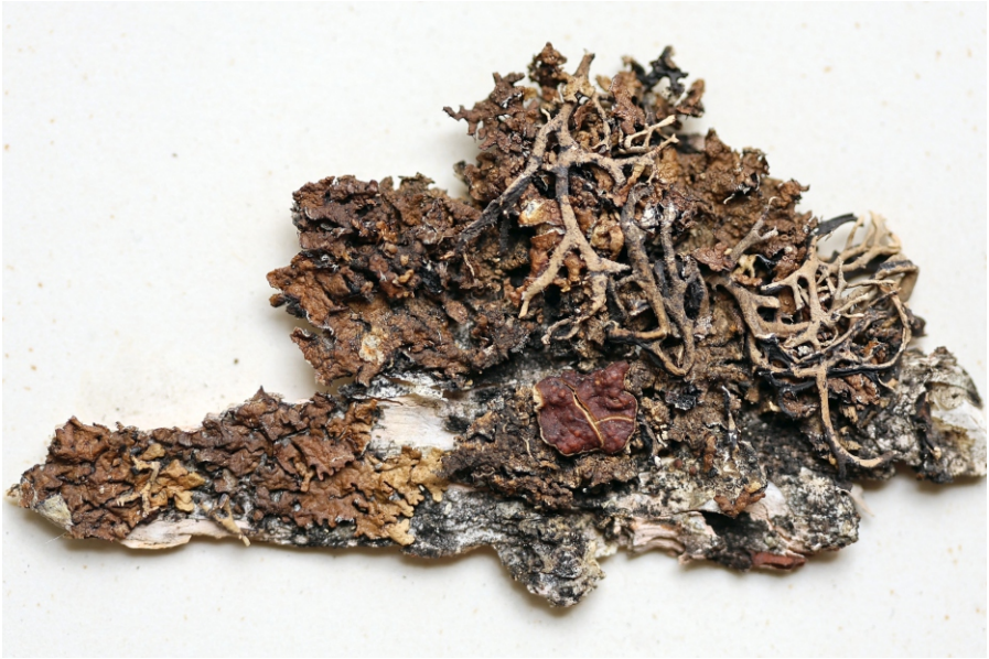
Obr. 1. Položka Melanohalea olivacea PLL 158/213.

jako častou. Vzácně ji zmiňuje i z dalších oblastí jižních Čech, Brd a Jeseníků. Suzou uvedená lokalita z Brd patří nálezu A. Hilitzera z brízy z Vůznic u Mníšku (Hilitzer 1924 – nejspíš obec Voznice u Mníšku pod Brdy). Vzhledem k dřívějšímu nerozlišování M. septentrionalis však tyto údaje vyžadují revizi herbářových dokladů. Dosud byla revidována pouze jediná položka ze Šumavy, a to na Parmelia [= M. ] septentrionalis (Ahti 1966, Wirth & Türk 1973). Pozdější nálezy těchto taxonů chybí, a proto byly do nedávna obě terčovky v České republice považovány za vyhynulé. Až v letošním roce nalezl J. Malíček na Šumavě M. olivacea (Malíček et al. 2025). Herbářové doklady ke zbylým údajům F. Malocha o Parmelia exasperata z Brd (Maloch 1913, str. 75: „Na jasanech u mysl. St. světa. Na olších v smrk. dle Padrtřs. ptka u Záběhlé“) v PL chybějí.