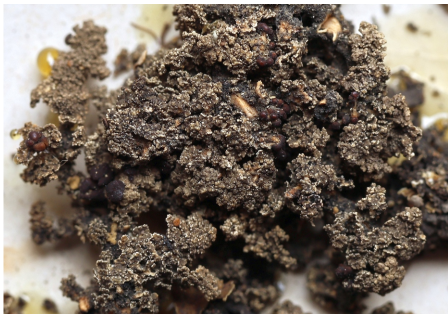
Obr. 4. Položka Stereocaulon tomentosum PLL 133/32.